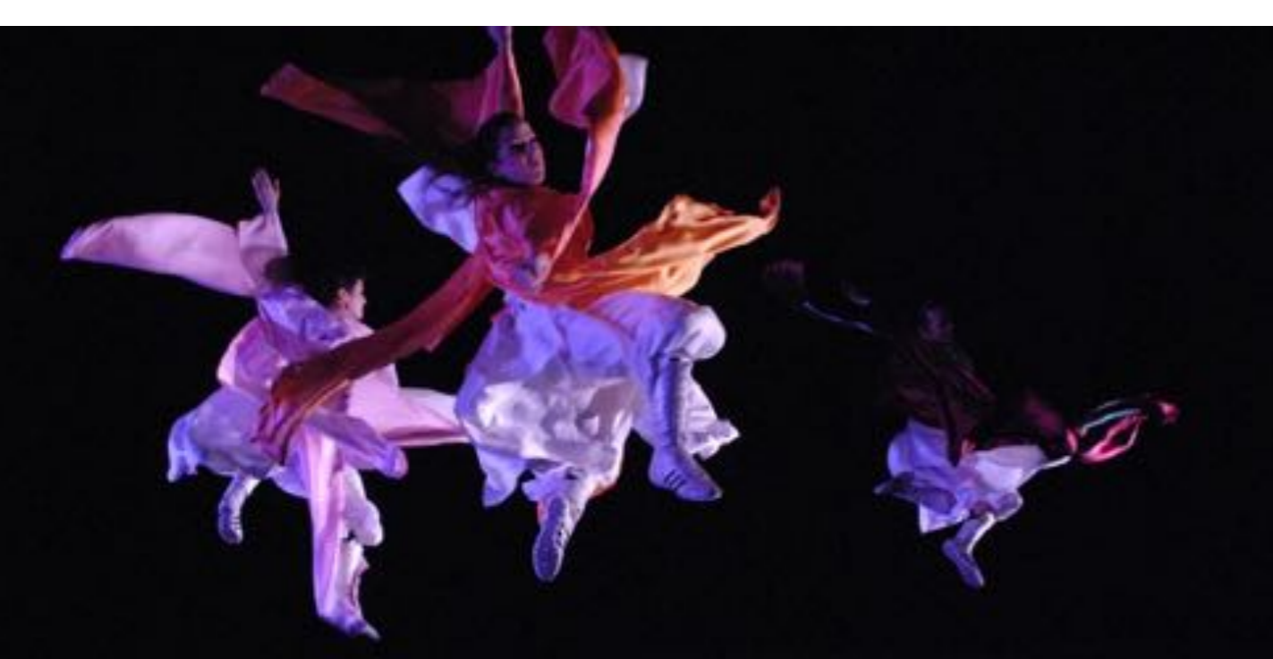
BLOSSOM: ROXY THEATER BASEL Inszenierung by Sanja Ristic