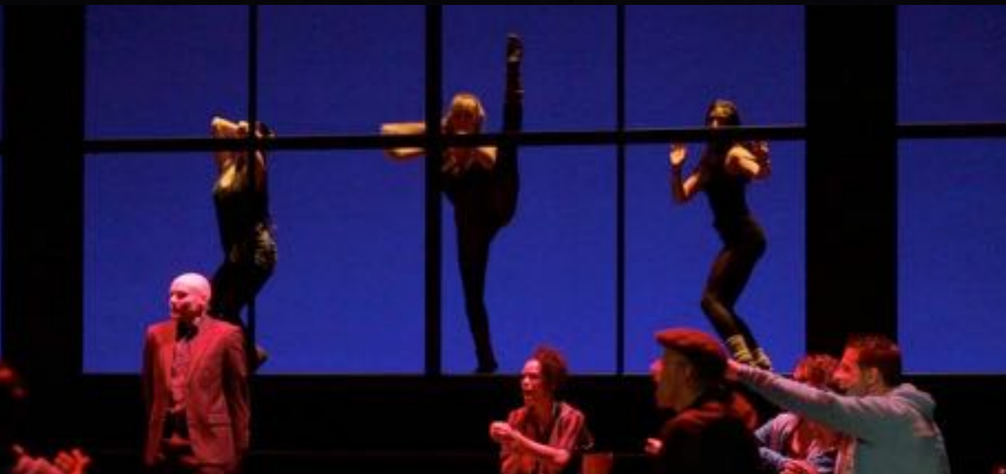
FAME: THEATER BASEL Choreographie by Sanja Ristic