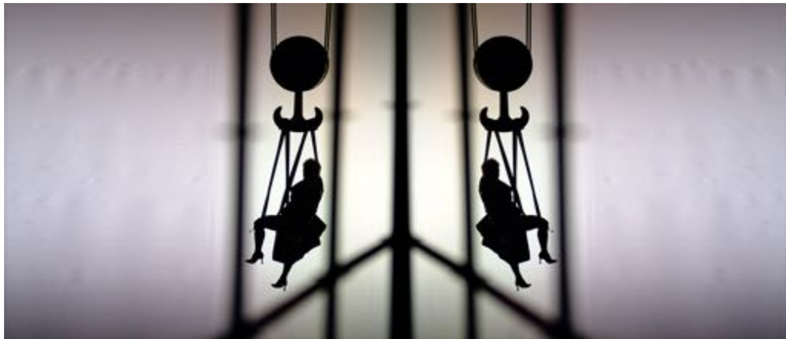
MODEFACT : HALLE7 BASEL Konzept, Idee, Inszenierung by Sanja Ristic