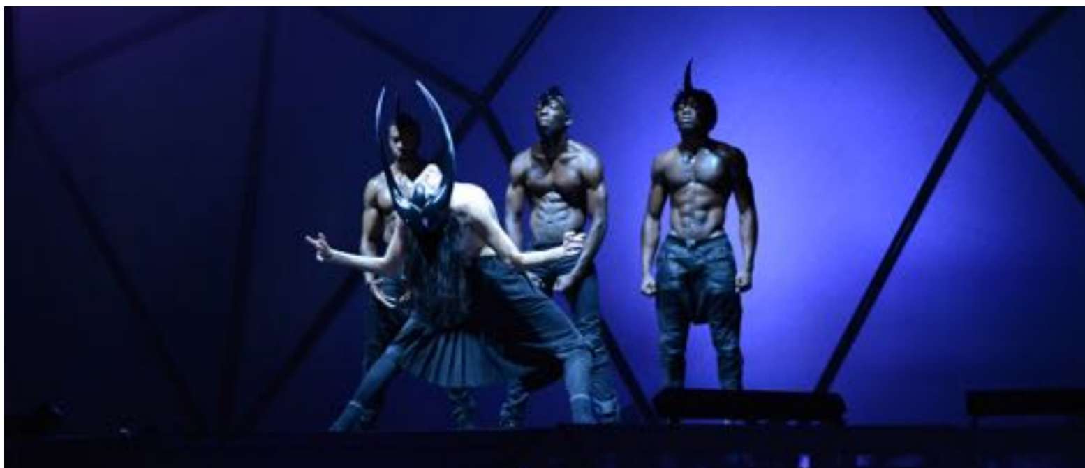
ANIMAL INSTINCT : MUFFATHALLE MÜNCHEN Konzept, Idee, Inszenierung by Sanja Ristic