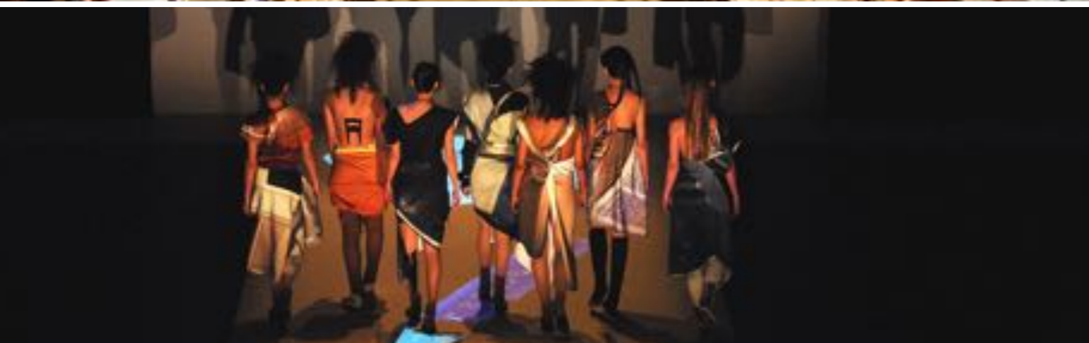
K & K / MODENSCHAU : HGKZ BASEL Konzept, Idee, Inszenierung by Sanja Ristic