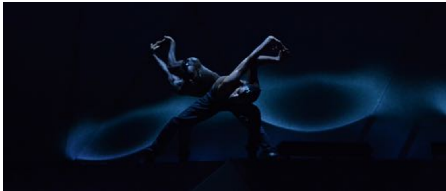
ANIMAL INSTINCT : MUFFATHALLE MÜNCHEN Konzept, Idee, Inszenierung by Sanja Ristic