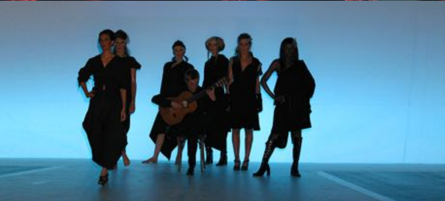
K & K / MODENSCHAU : HGKZ BASEL Konzept, Idee, Inszenierung by Sanja Ristic