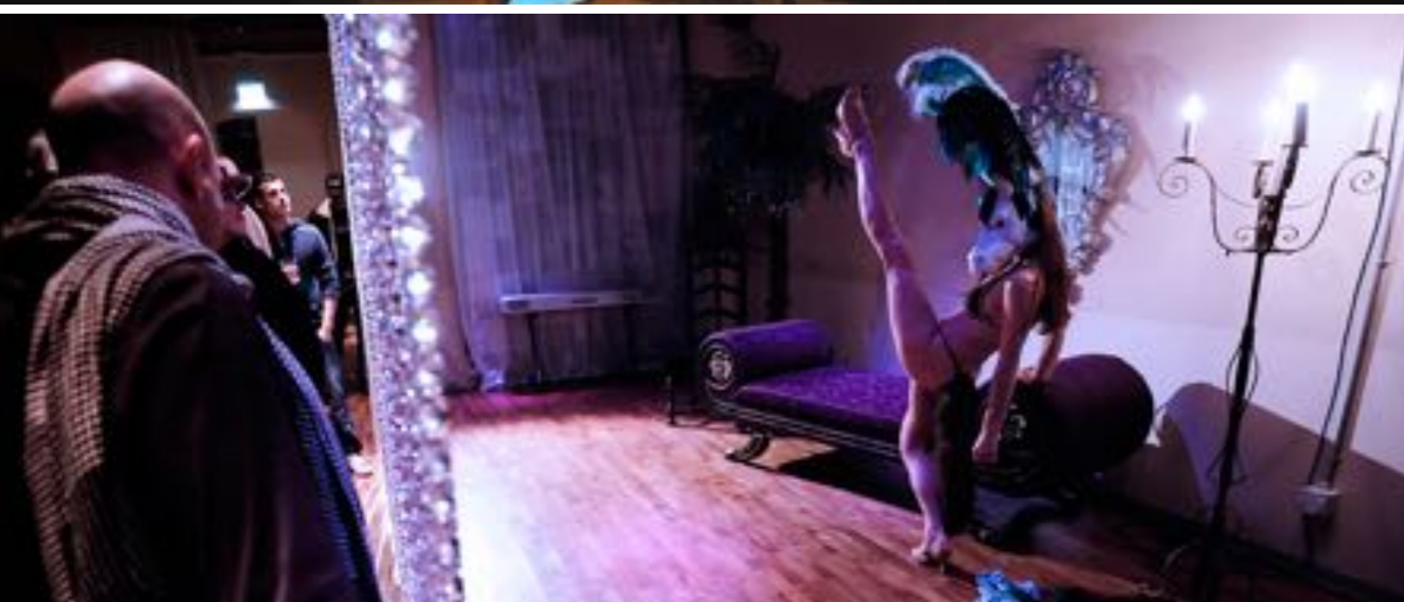
SALON SAUVAGE : KASERNE BASEL Konzept, Idee, Inszenierung by Sanja Ristic