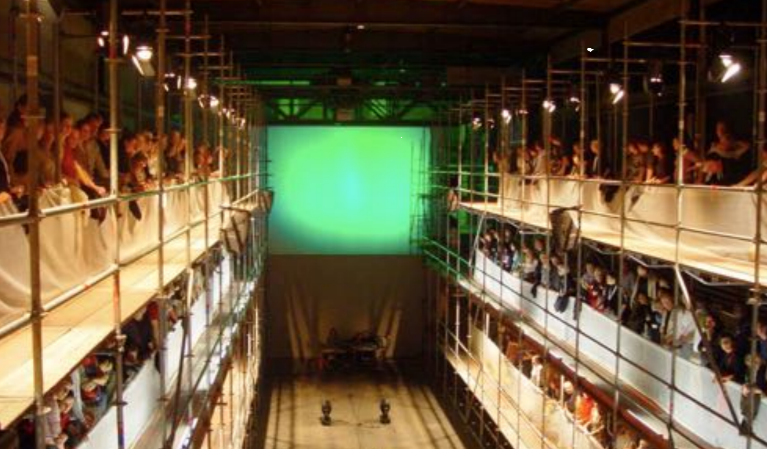
MODEFACT : HALLE7 BASEL Konzept, Idee, Inszenierung by Sanja Ristic